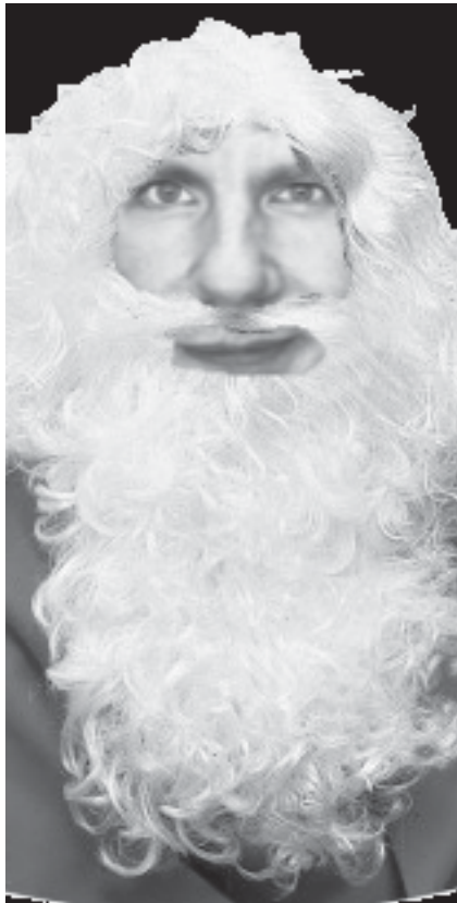
Bjørn Lomborg, der som profet ikke er agtet i sit eget hjemland: Konklusionen er, at hvis julemanden nogensinde deler gaver ud juleaften, er han død nu

Bjørn Lomborg tror ikke på klimaproblemer og fører her videnskabeligt bevis for, at heller ikke julemanden eksisterer