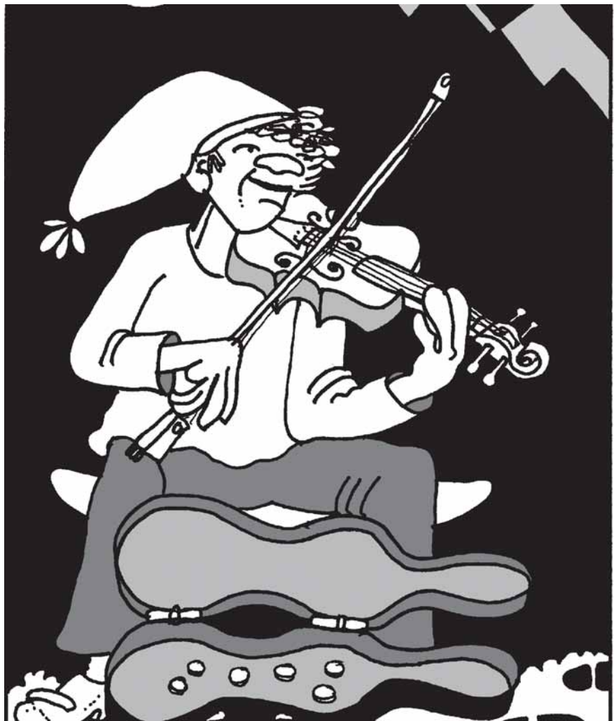
Julemanden forsøger at overleve som gademusikant, men Bjørn Lomborgs videnskabelige bevis på, at han er „non-existing“, tager alligevel livet af ham

Konklusionen er, at hvis julemanden nogen siden deler gaver ud juleaften, er han død nu.