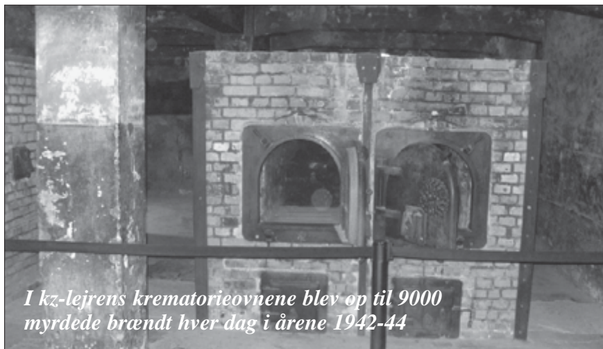
I kz-lejrens krematorieovnene blev op til 9000 myrdede brændt hver dag i årene 1942-44

Her kunne man slå flere hundrede ihjel på kort tid og derefter brænde ligene. Rundvisningen omfattede også de no-