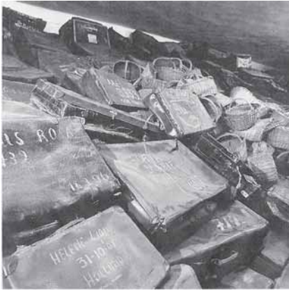
Rystende tragisk er det, at blive konfronteret med de mange mio. myrdedes efterladte ejendele

get støvede, men stadig tankevækkende, samlinger fra "Canada". Canada var den uofficielle betegnelse for de depoter, tyskerne lavede af fangernes ejendele. Ved ankomsten blev alt taget fra dem. Genstandene var nu den tyske stats ejendom.