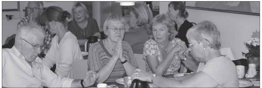
Mange bad til, at vi får en seniorpolitik