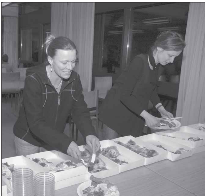
Traditionen tro byder Helsingør Lærerforening på et stykke smørrebrød efter generalforsamlingen den 16. marts