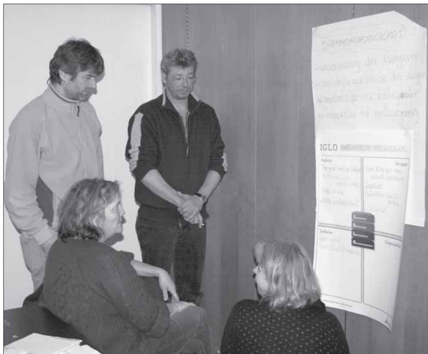
Drømmearbejdspladsen beskrevet på årets TR-kursus på Orø

Ifølge Hovedforeningens retningslinier for medlemshenvendelser starter kontakten til foreningen ved henvendelse til tillidsrepræsentanten på arbejdsstedet, og TR løser også rigtig mange opgaver på skolerne, men har, hvis forholdene strammer til, ofte brug for sparring